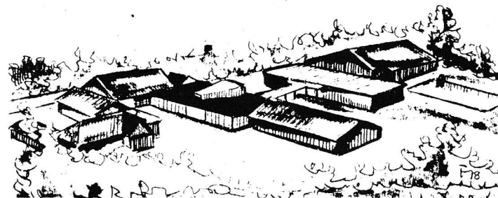
udstedt af Sønderjysk Idrætsforening