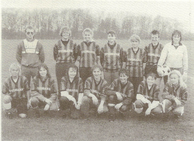
Damer Serie II holdet fra den 1.hjemmekamp i Serie II mod Ammitsbøl.