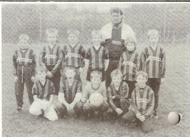
1.holdet som spillede mod Ulkebøl, de vandt så til gengæld med 21 - 0