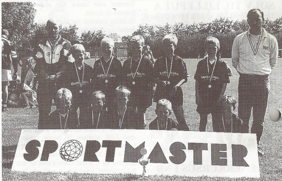
Nord-Als Boldklub's miniputhold - vinder af ÅBK's SPORTMASTER-CUP i pinsen 1997