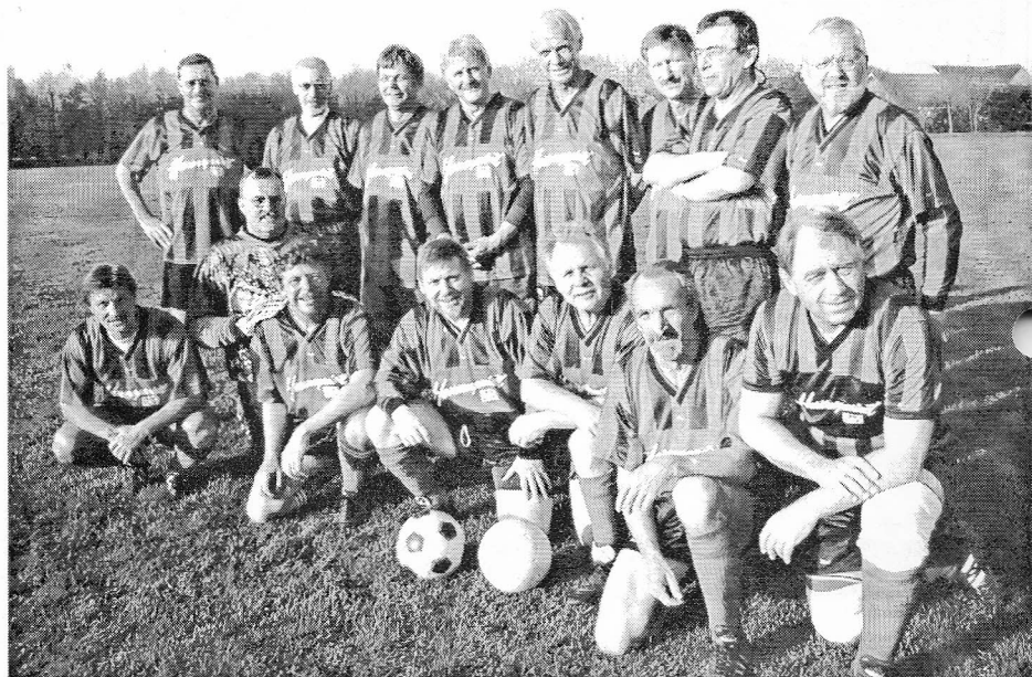
Også olboysholdene er færdig med forårsturneringen. Oldboys A er nr. 5, veteranerne er på en 3. plads og superveteranerne ( billede ) er nr. 12 i en række med 15 hold.