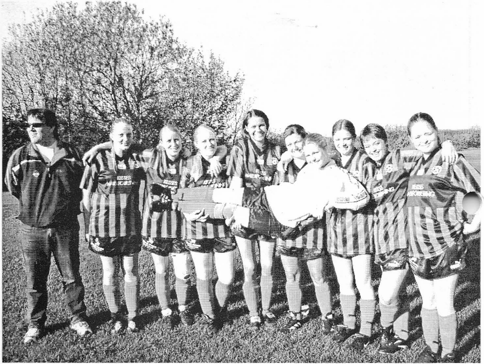
NB's damehold er på en 4. plads efter forårsturneringen