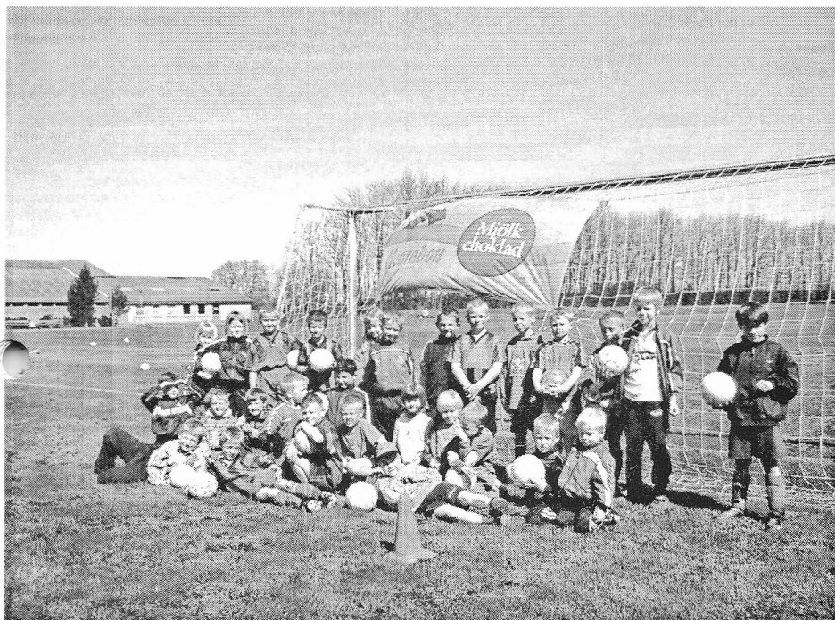
Søndag den 6. maj afholdt NB's ungdomsafdeling den populære "Marabou dag".

Det blev til en omgang minigolf, grillpølser og en øl eller sodavand til de ca. 30 deltagere.