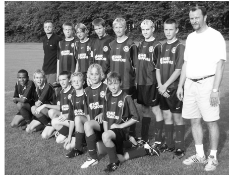
Et godt år for drengeholdet og andre

Ja så er udendørs sæsonen slut og det er godt. Med alt det regn og rusk, er tiden mere til indendørstræning. Der har været spillet mange kampe, med forskellige resultater. Alle har helt sikkert hygget sig, og jeg håber man har mange gode minder fra sæsonen.