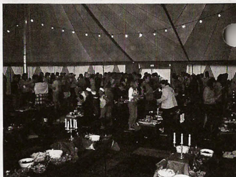
Glimt fra Damefrokost 2004 som i år afvikles fredag den 22. april.