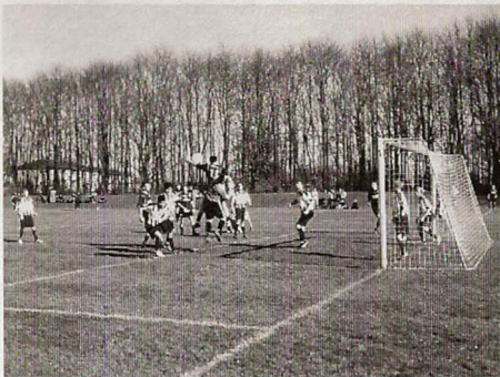
Fra kampen NB-Fremad S. 1 – 4

Det samme gør sig også gældende, når vi taler om de områder, hvor det er svært at finde "frivillige" hjælpere. Her må vi også ud og "sælge opgaven".