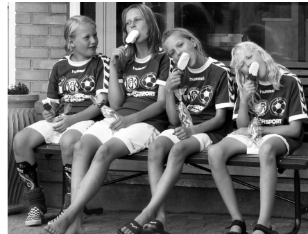
Næste år afvikles NB's PIGECUP den 18. august. VI SES!