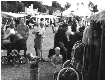
Kun om fredagen (Kulturmatten) var festpladsen godt besøgt.

Selvom om Nordborg Kræmmerfestival forløb godt og det efter styregruppens opfattelse havde et fint program, så svigtede publikum både om lørdagen og om søndagen. Her havde vi og tivoli håbet på langt flere besøgende. Derfor bliver den økonomiske side af arrangementet ikke så spændende. Vi kommer ca. ud med samme resultat som i 2005, hvor vi havde et underskud på 15.000 kr. For en god ordens skyld bør det lige anføres, at det endelige regnskab ikke er gjort op. Men det er bedste bud på et resultat her i skrivende stund. Desværre.