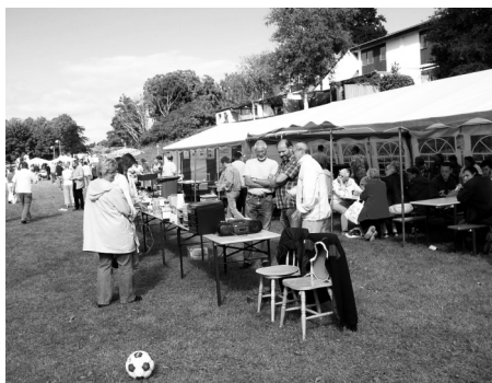
NB's stand på Kræmmerfestivalen

noget lignende i fremtiden. Dette er der absolut mange meninger om. Lad os se, hvor vi ender. Det vil den kommende tid give svar på.