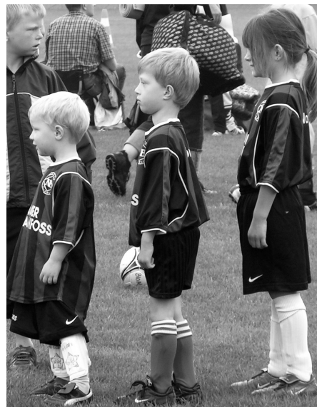
"3 NB-størrelser" er klar til kamp

Nogle var lidt langærmede og kunne have været en fin sommerkjole, men det betyder ingenting når kampgejsten er i top.