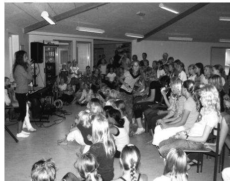
Fest & hygge på Friskolen Østerlund