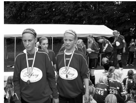
Gæster fra Tyskland

Stævnet er gennem de første år blevet større og større, for i år at modtage det største antal hold, nemlig 60, og dermed ca. 600 spillere plus deres forældre og trænere, fordelt over hold fra det meste af Danmark og krydret med deltagende klubber fra Tyskland.