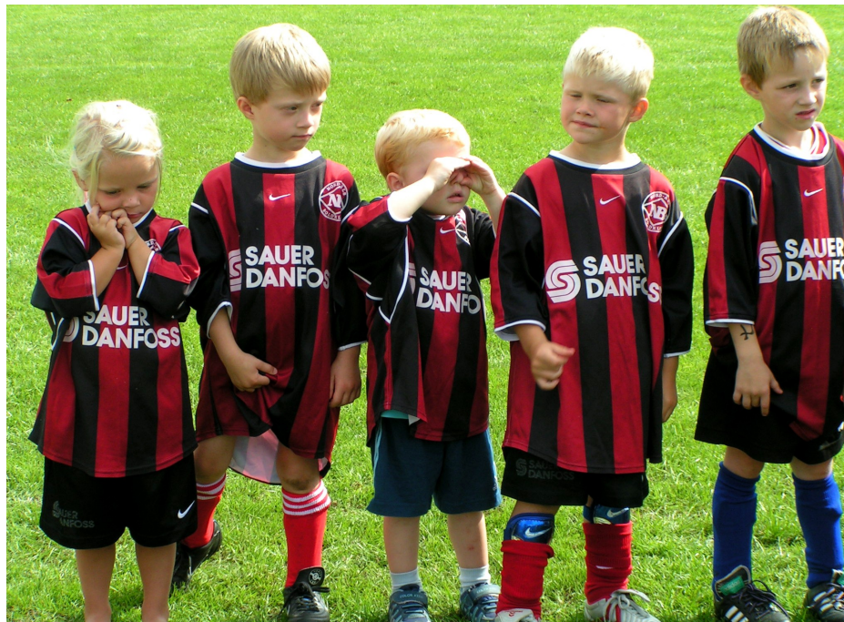
En flok af NB's "sandkassespillere" venter spændt på ..... hvad? Se bagsiden!

Nord-Als Boldklub's klubblad - 37. årgang - Nr. 6 - sep. 2006