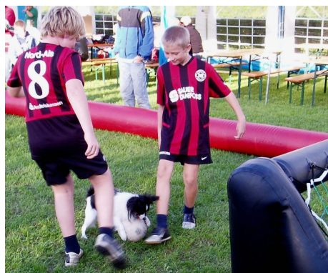
Buller optrådte på Kræmmerfestivalen