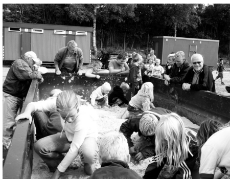
Trængsel i "skattekisten"