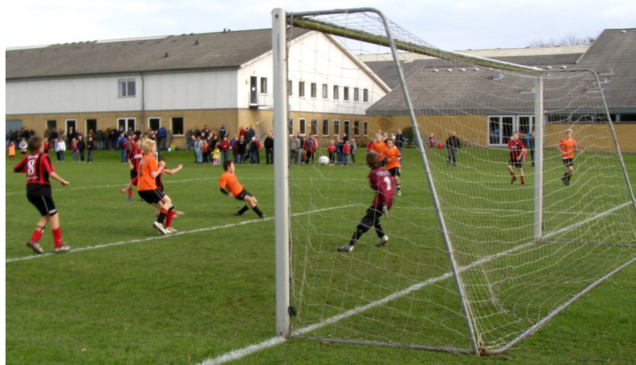
Tilskuerrekord på bane 2!

Alligevel mødte rigtig mange frem til denne kamp, stadionrekord de sidste mange år vel sagtens. Det skal fra os trænere og spillere lyde en stor tak for den store opbakning, så er det sgu sjovt at spille fodbold. Vi spiller ikke vores bedste kamp denne eftermiddag. Om det var modstanderen, der ikke tillod det, kan man jo altid spørge sig selv. Kampen bliver meget lige, hvor vi nok har bolden lidt mere end modstanderen uden at vi kommer til de helt store chancer så får Lyseng udnyttet de 2 chancer de får så kampen ender 2-0 til Lyseng, helt fortjent.