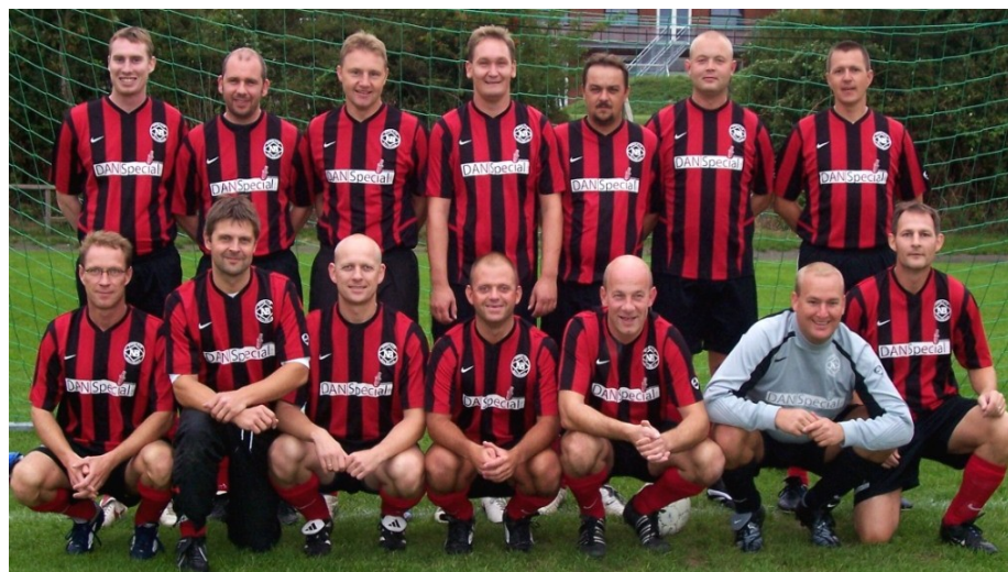
Oldboysholdet klarede sig godt i sæsonen 2006

Sportigan Cup blev afholdt søndag den 4. marts 2007.