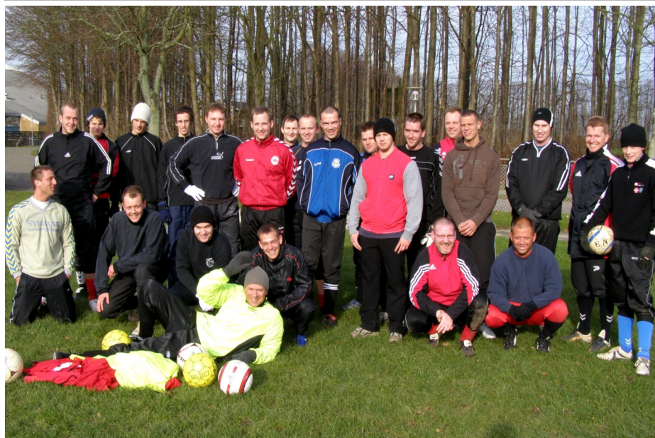
Træningsstart for seniorspillerne

Men i år bør vi ikke fokusere så meget på, at det "kun er serie 5" for begge vore 2 senior hold - selvom det unægtelig var for dårligt, at første holdet ikke formåede at blive i serie 4. Men jeg mener derimod, at vi skal rette fokus på, hvorfor vi i bund og grund kommer til træning.