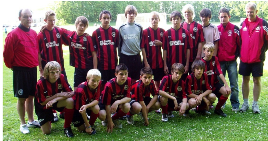
2006 var et godt år for drengenaftningen