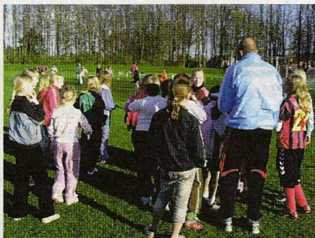
"Pigeraketten" hos NB med 64 piger!