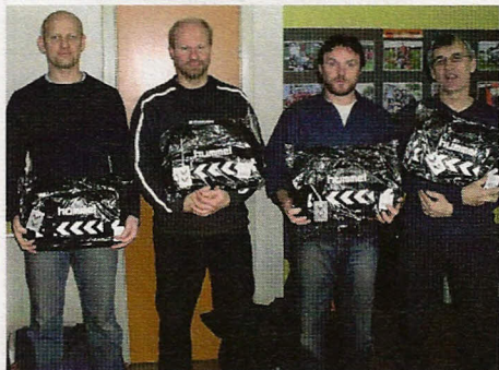
Et af vinderholdene

Efter et hurtigt bad, for nogle dog langsomt, skulle de gule ærter så fortæres. De smagte som sædvanen tro rigtig godt, de er gode til at lave denne ret i NIC's køkken!