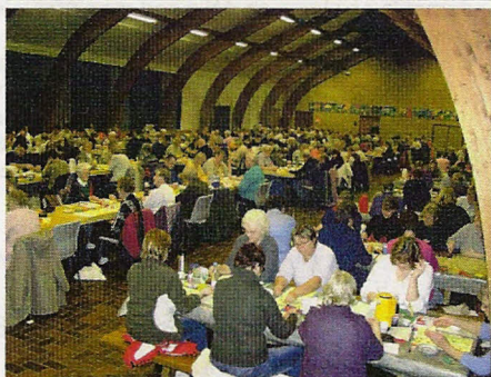
Et par af NB's "neben-aktiviteter"