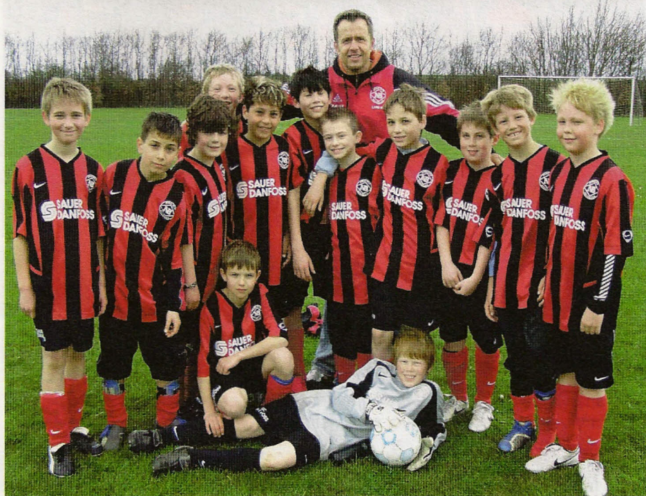
Nord-Als Boldklub's "U12 hold" (før kaldt lilleputter) efter 6-3 sejren over BNS

Nord-Als Boldklub's klubblad - 38. årgang - Nr. 3 - maj 2007