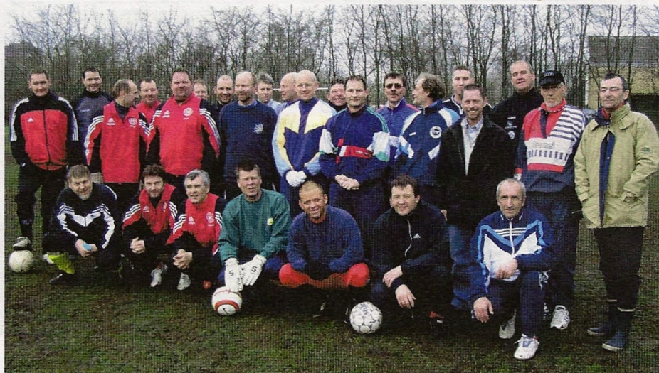
Deltagerne ved årets stævne