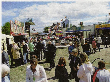
FEST-I-BY programmet på side 10-11