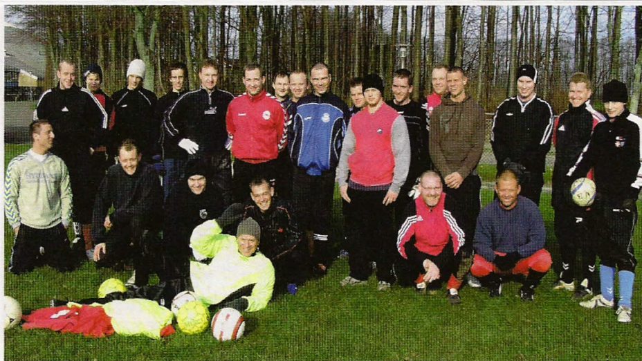
Seniorspillernes første dag "på græs" i sæsonen 2007