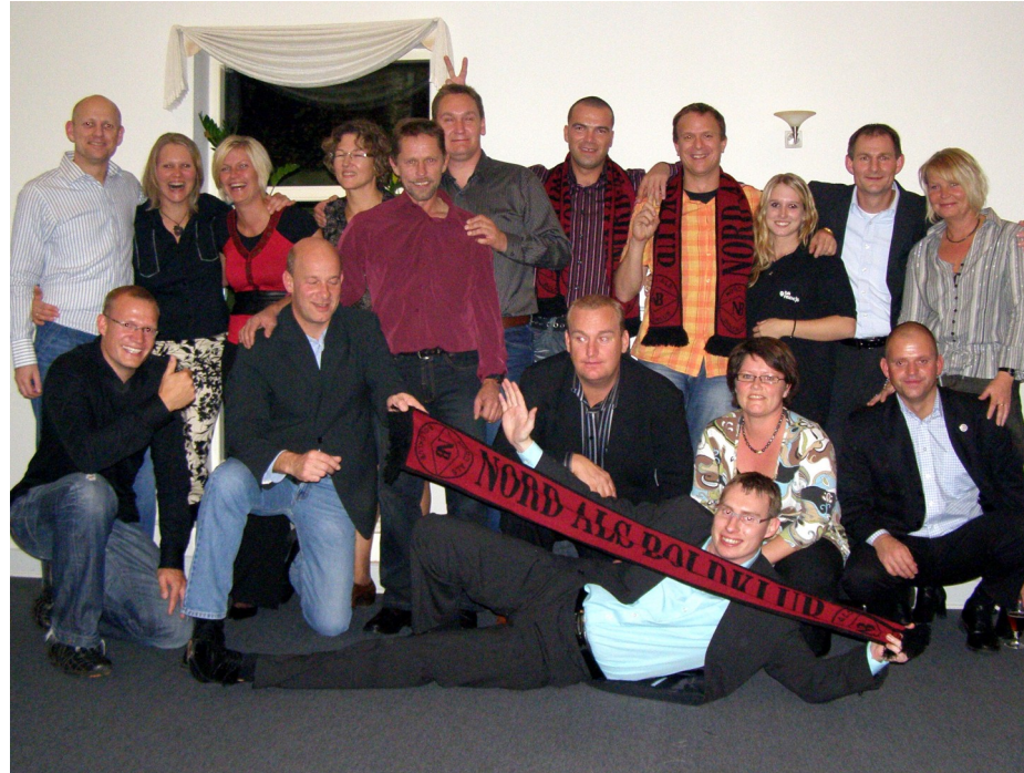
Oldboyspillernes "familiefoto" blev taget på afslutningsfesten