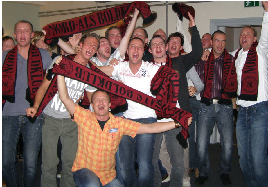
NB's 1.hold fejrer oprykningen på afslutningsfesten 2007

Nord-Als Boldklub ønsker en glædelig jul og et godt nytår alle sine medlemmer og deres familie, venner af klubben, alle annoncører, samt sponsorerne.