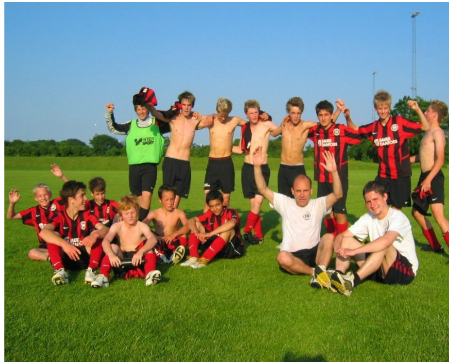
Juni 2007: Oprykningen til mesterrække er sikret!

At holdet kun nåede at spille en regionskamp på trods af sejr, skyldes at holdet i netop denne kamp, benyttede en ikke spilleberettiget spiller og efter protest fra modstanderen, blev holdet desværre udelukket.