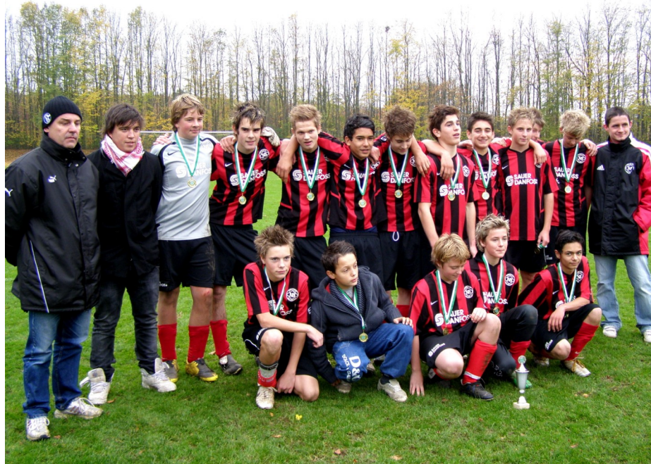
Guldmedaljer til NB's drenge!