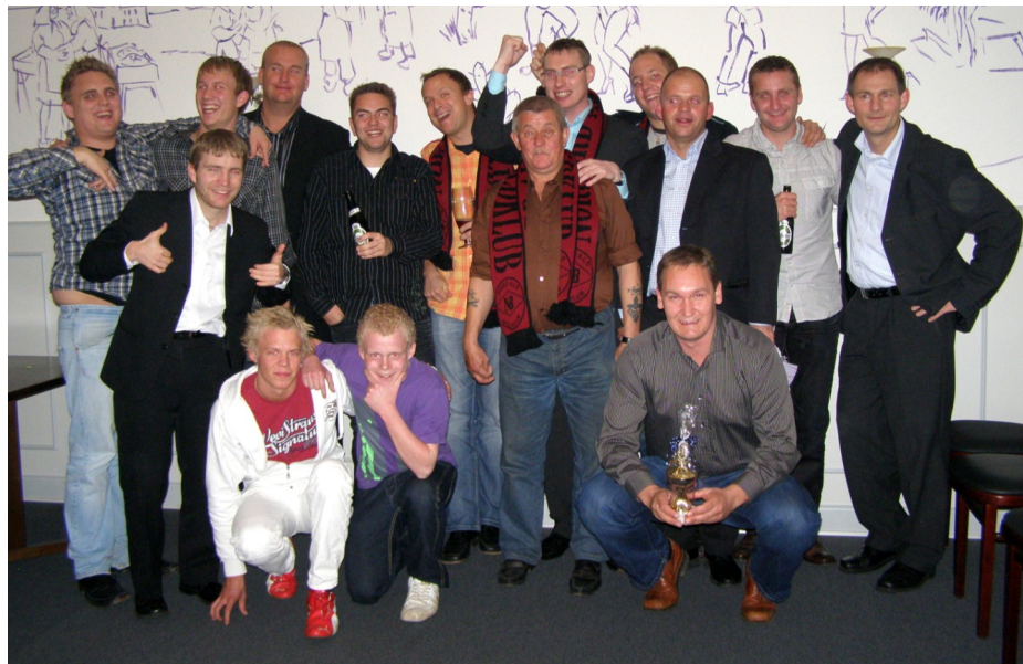
"Næstenoprykkere" fra 2.holdet fejrede en god sæson