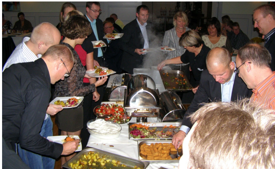
Restaurantens lækre og spændende buffet var igen et stort tilløbsstykke.

Et par billeder fra festen vises på de følgende sider.