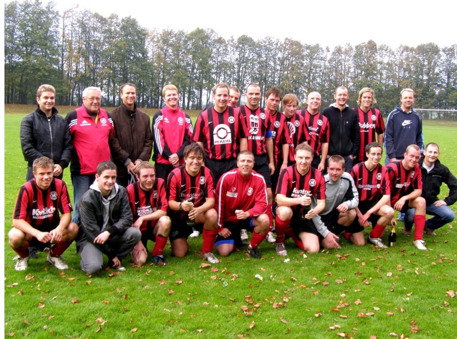
NB's 1.hold spiller næste år i serie 4

Men specielt de rigtig mange tilskuere der støttede os i den 2. kreds-kamp, på hjemmebane mod Fredericia FF, fik noget flot fodbold at se. En kamp vi vandt 6-4, over den absolut bedste modstander vi har mødt i år. Så nu kan vi begynde at se frem til en spændende sæson i 2008.