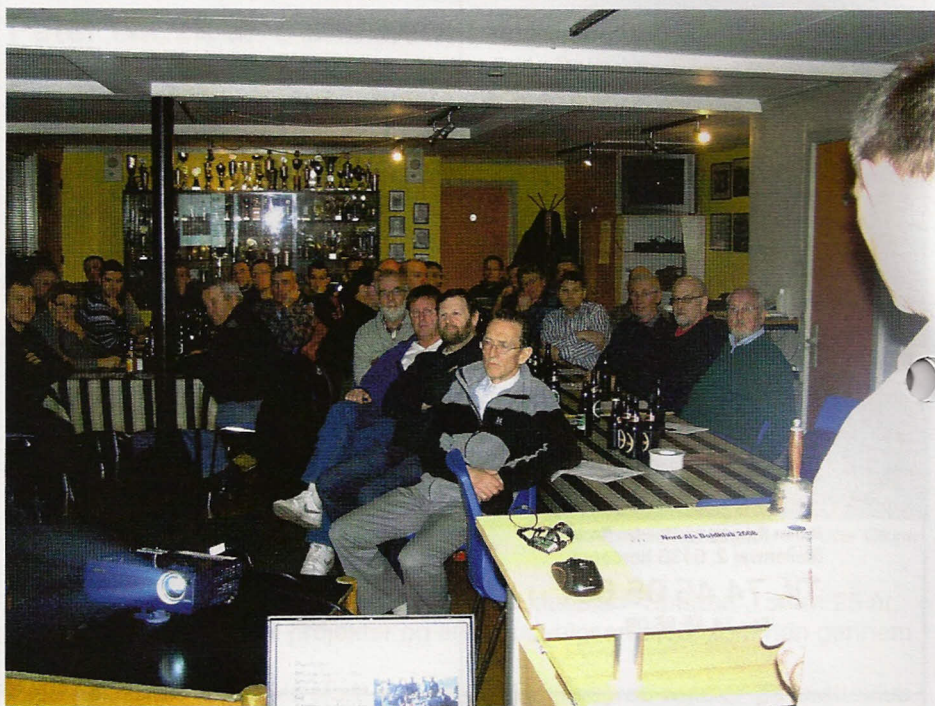
Arkivfoto Generalforsamling 2009