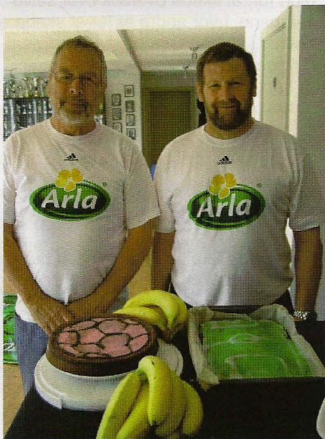
Billederne er fra Fodboldskolen 2009