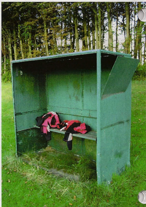
Der er vel ingen som vil savne "blikskurene"!

Fra klubbens side skal hermed lyde en stor tak til både Nordals Idrætsfond & Idrætscenteret, idet det ikke just er en billig fornøjelse at erhverve sig spillerbokse. Den type vi får, er set udbudt til omkring 27.000 kr. ex. moms ( pr stk. ! ) – Idrætscenteret har dog formået at skaffe et bedre tilbud, og det gør naturligvis ikke glæden mindre.