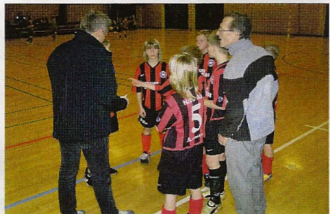
NB's U11 efter kampen mod Dybbøl. Holdet fik en 2.plads i stævnet.