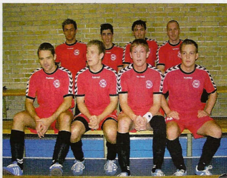
NB's senior "Futsalhold" fik ingen medaljer

Den anden semifinaler, Tim Talento - FC Fluerne, sluttede 1-0 (0-0) og blev en meget taktisk affære, men også en