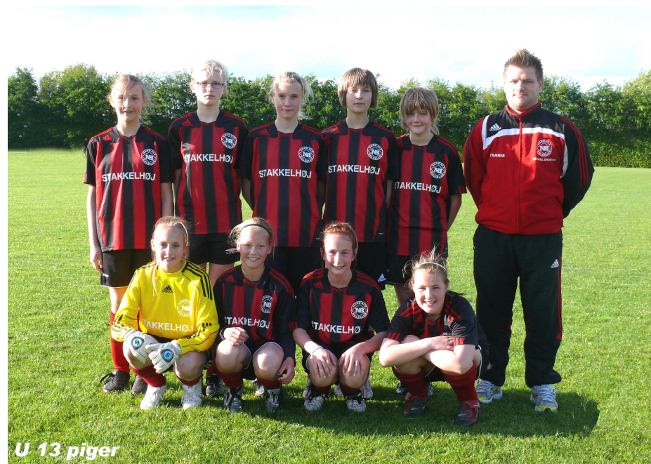
U 13 piger