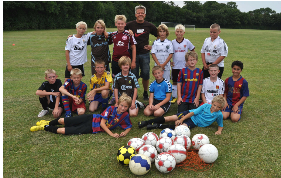
U12 afdelingen er mødt op til træningen