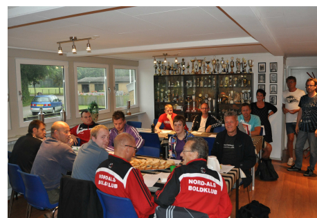
Træner-/ledermøde i ungdomsafdeling