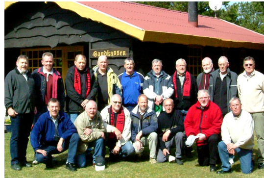
Arkivfoto: Vejershold 2005 (holdets første "træningslejr" var i 1990)