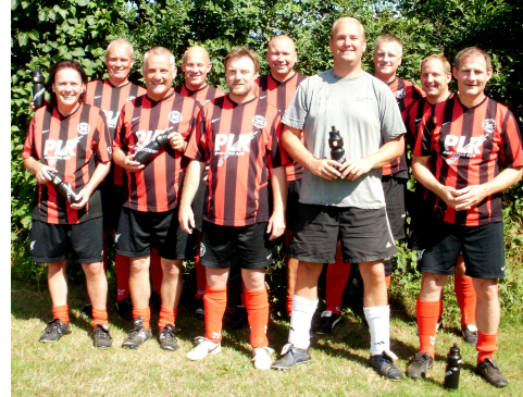
"De rutinerede fra NB"