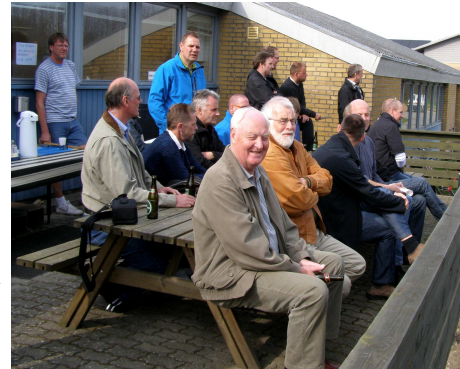
Det bliver spændende at se hvad der sker med NB's klubhuset i nærmeste fremtid.