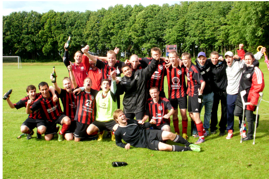
..... det er ikke så længe siden!

holde det niveau igennem efteråret så er jeg ikke i tvivl om at det bliver et godt et af slagsen. Men som i foråret er det den enkelte spillers prioritering, både i forhold til træning i hverdagen og kamp i weekenden, som bliver nøglen til succes. I foråret har jeg ikke haft en finger at sætte på spillernes prioritering og jeg håber heller ikke at have det når sæsonen slutter i november.