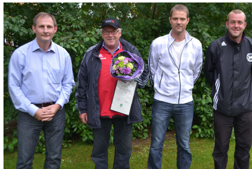
Henning med tre 1. holdstrænere, der også har haft fornøjelsen at arbejde sammen med ham.

skylder klubben også en varm tak. Uden hendes opbakning og hjælp havde dette overhovedet ikke været muligt.