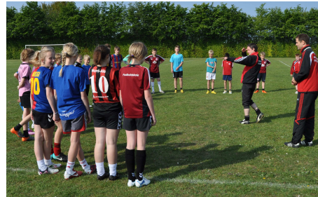
Arkivfoto maj 2011

I foråret har vi fokuseret meget på indersidespark, driblinger, finter og 1. berøringer. Disse fire elementer vil stadig have stor prioritet, da det er meget vigtige færdigheder i fodboldspillet. Derudover har vi stiftet bekendtskab med halvliggende vristspark og hovedstød. Der vil blive bygget videre og tilføjet nye elementer i efteråret.