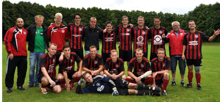
1. holdet fik en "godkendt" 3. plads i serie 2

Nok ikke lige det man havde forventet, men kvag ovenstående samt Fremads hurtige oprykning, må vi sige det er godkendt. Serkan har gennem hele sæsonen formået, at holde humøret højt over hele linjen, hvilket tyder godt til efteråret. Vi ser frem mod efterårets udfordringer og gennem hårdt arbejde og kammeratskab, vil vi igen være med til at præge rækken i serie 5.