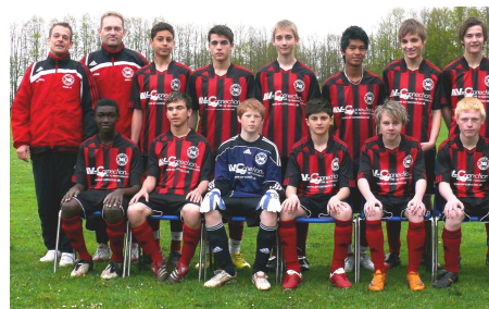
Arkivfoto : U15 holdet i 2010

Tilgangen har også resulteret i at NB kunne tilmelde et U15 pige hold til turneringen, der startede i august. >>>