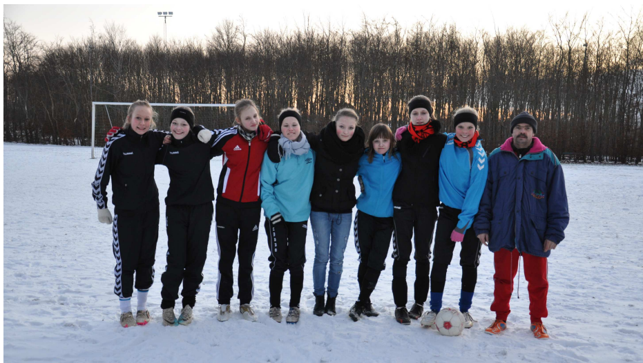
U15 pigerne til vintertræning på lysbanen.