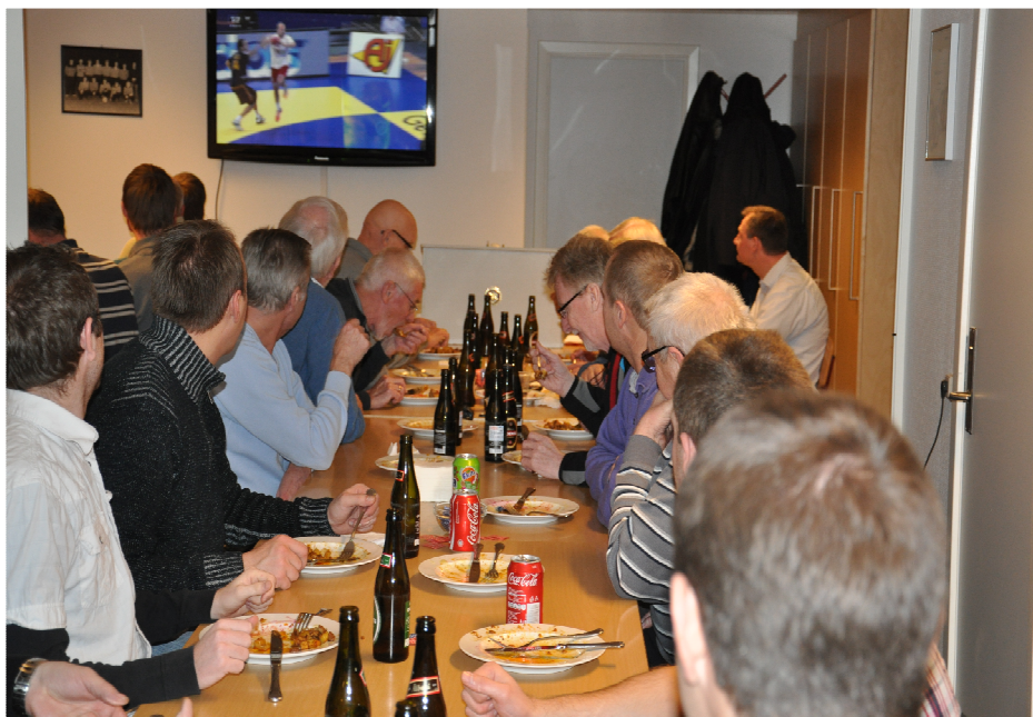
God mad krydret med en spændende håndbold semifinale