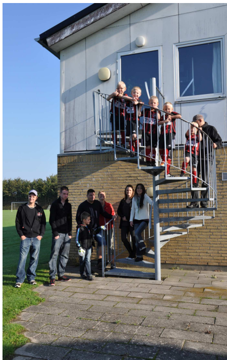
U6 holdet sep. 2011