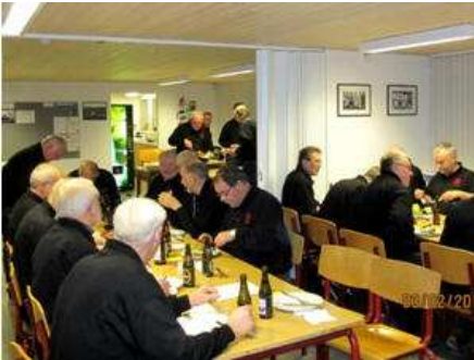
Club22 afholder generalforsamling

Formandens beretning var traditionen tro krydret med en masse billeder fra det forløbne års arrangementer, som f.eks. de "officielle" kvartalsmøder, et par spændende foredrag, grillaftener, sejltur, week-endophold på St. Pauli og turene "ud