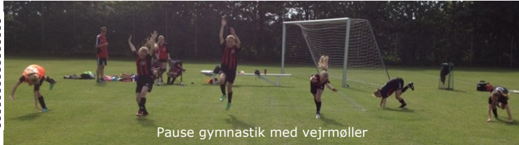
Pause gymnastik med vejrmøller

Brug bolden fornuftigt. Bliv medlem af 3F Als i Guderup.