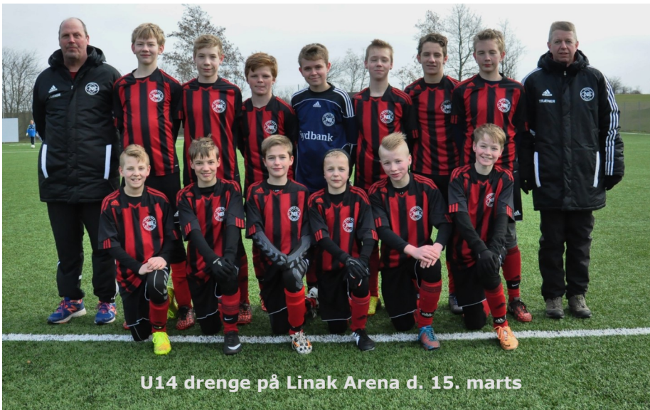
U14 drenge på Linak Arena d. 15. marts