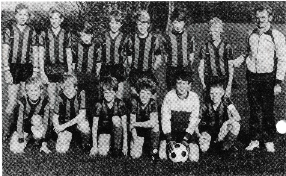
Kredsvinder:Lilleput J.B.U. - A