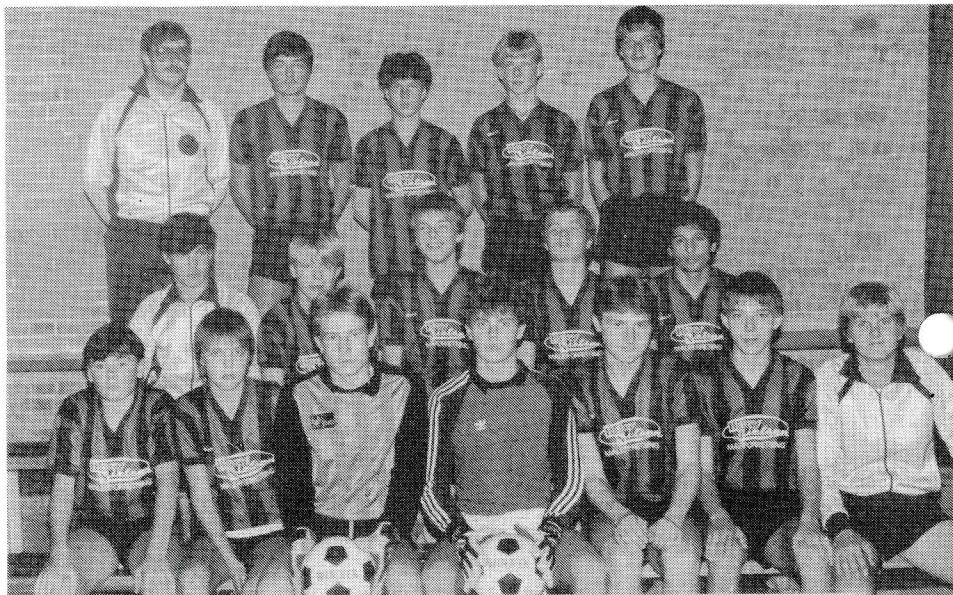
Kredsvinder:Junior J.B.U. - A