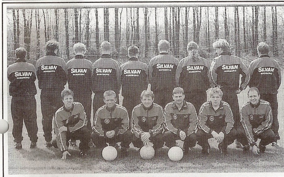
Nord-Als Boldklub siger tak til SILVAN i Nordborg for træningsdragterne til 1.holdet.