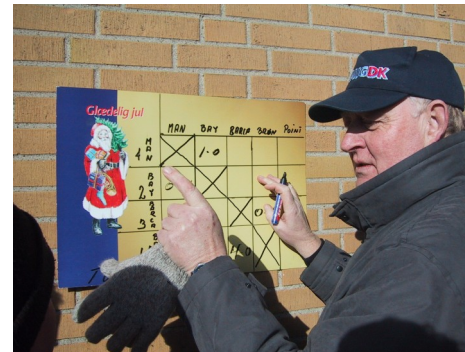
Stævneledelsen ved Piccolo Cup 2002

Klubben håber naturligvis, at mange forældre vil møde op til disse møder, så man i fællesskab kan få planlagt en god og spændende sæson for alle klubbens afdelinger.