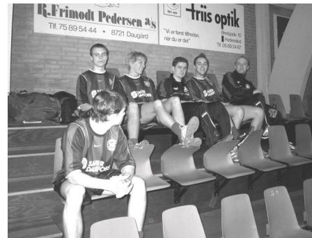
Ynglingeholdet i Hedensted

Søndag var vores spil meget bedre, selv om det ikke var optimalt. Men vi vandt da først kamp 8-0 over Grejsdal. Den næste blev vundet 5-3 over Klokkeholm.