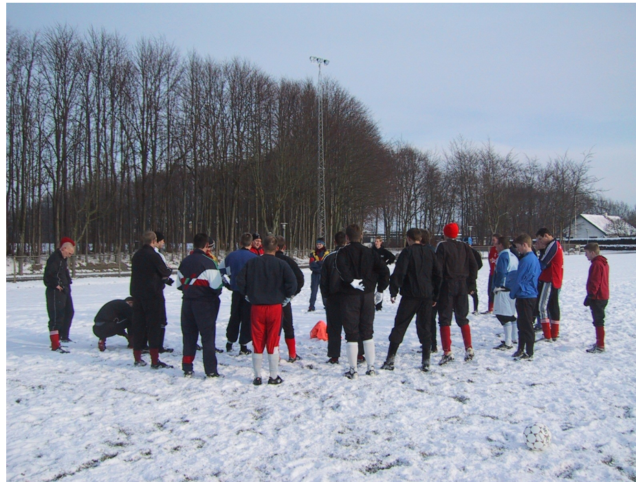
Seniorholdene er "på græs" igen

Nord-Als Boldklub's klubblad - 34. årgang - Nr. 1 - feb. 2003