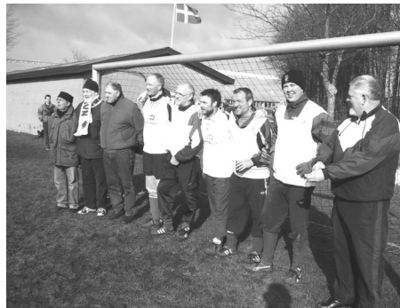
Vinderholdet ved PICCOLO CUP 04