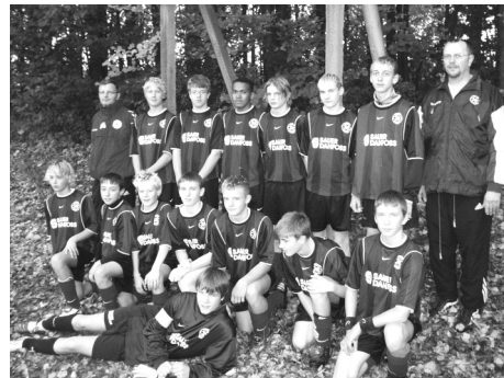
Der satses på at tilmelde A hold i alle 11 mands rækker