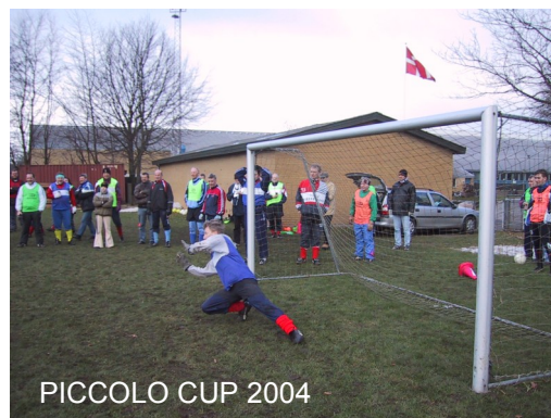
PICCOLO CUP 2004