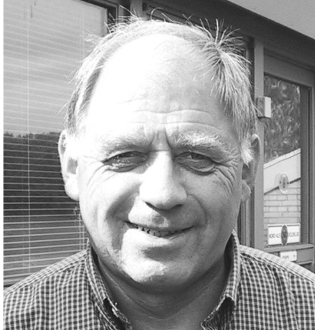
OB formand Peer mangler holdledere

Derfor denne bøn til de aktive spillere på de 2 hold, vi skal da gerne spille fodbold i år ?