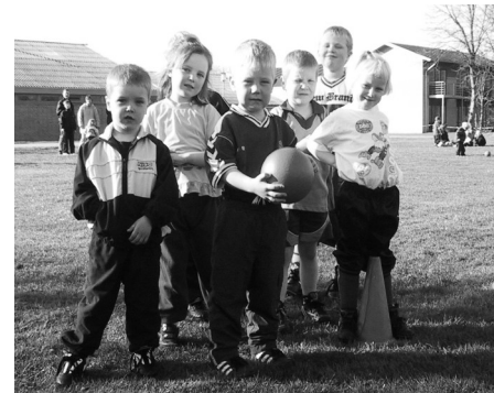
Man kan starte "meget tidlig" i NB