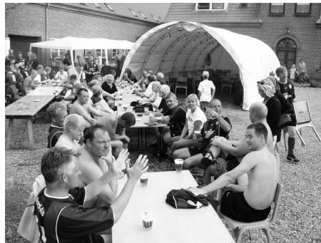
Et velfungerende socialt miljø ønskes

Såfremt der udvises initiativ, interesse og velvilje fra medlemmerne i afdelingen, tilstræbes det derfor, at man tilbydes at deltage i et større og et mindre fælles arrangement pr. sæson, finansieret helt eller delvist af klubben alt afhængig af arrangementets størrelse og udformning.