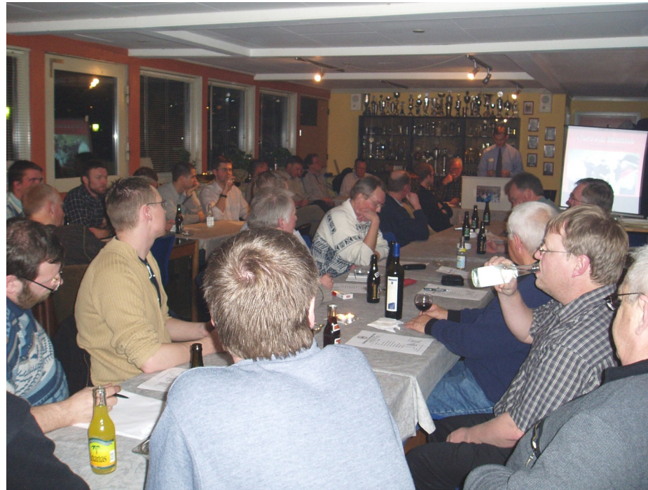
Nord-Als Boldklub har afholdt generalforsamling den 28.01.05 i klubhuset. Læs mere om årsmødet inde i bladet.

Nord-Als Boldklub's klubblad - 36. årgang - Nr. 1 - feb. 2005