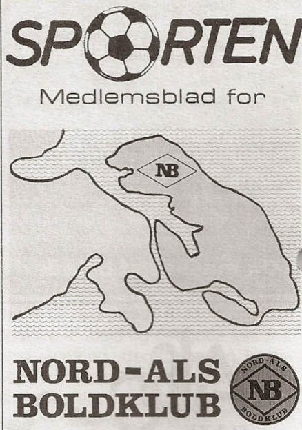
Forside af NB's klubblad i marts 1974