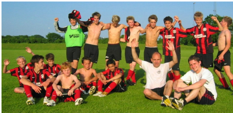
Oprykning i mesterrækken blev en realitet efter en udesejr på 2-1 over SUB/Dybbøl, der pt. lå som nummer to i A-rækken.

Dem til at yde deres yderste og koncentrere sig. Tabellen taler, efter vores mening, sit tydelige sprog. Den hårde og koncentrerede træning har båret frugt. Vi har i mange kampe været meget overlegne og vundet stort, men der er altid plads til forbedringer. Vi kan stadig blive meget bedre til, at lægge præcise afleveringer og spille hurtigt. Så der er stadig en masse at arbejde med, især når mesterrækken venter, for der går det altså bare en del hurtigere end i a-rækken. Det ved vi af erfaring.