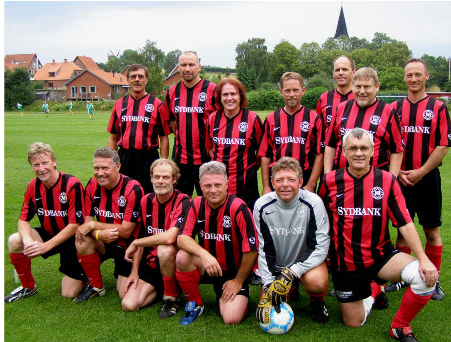
NB's Superveteraner før kampen mod EUI (2-2)