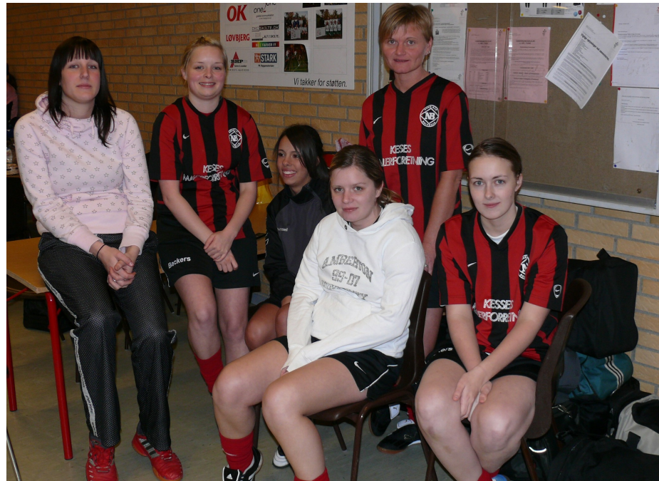
NB's damehold deltog i NÆSBY CUP 2008

Kampene blev afviklet med "rigtige" dommere, de dømte måske ikke så godt i alle kampene, men de fandt sig ikke i noget, mens vi sad og ventede på at det blev vores tur til at spille, var det en af de unge supportere der gav dommeren en ordentligt skideballe på banen uden at dommeren blinkede med øjnene, men knap havde han fløjtet kampen af, ham over banden, og så tog han en "alvorlig" samtale med den unge mand, der absolut intet skulle have klinket når dommeren stod så tæt på.