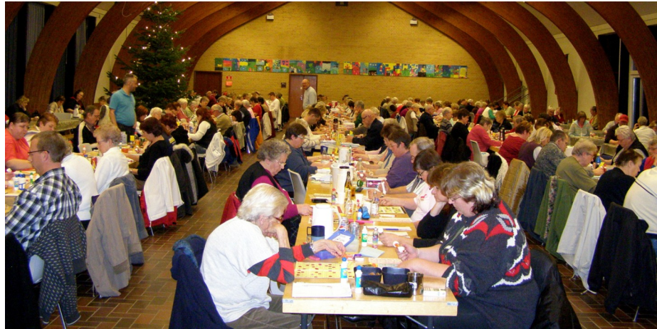
NB afholder lottospil hver onsdag i Havnbjerg skoles aula