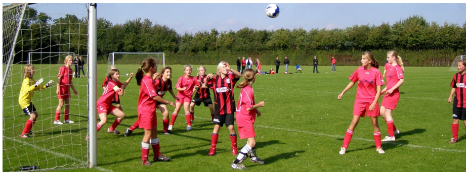
Et af NB's mange "gazelle-hold"

at være smidige hurtige og meget svære at indfange af andre vilddyr på nærliggende jagtmarker.