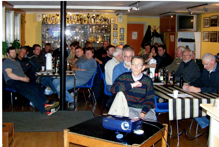
NB's generalforsamling blev afholdt i klubhuset fredag den 25. januar 2008