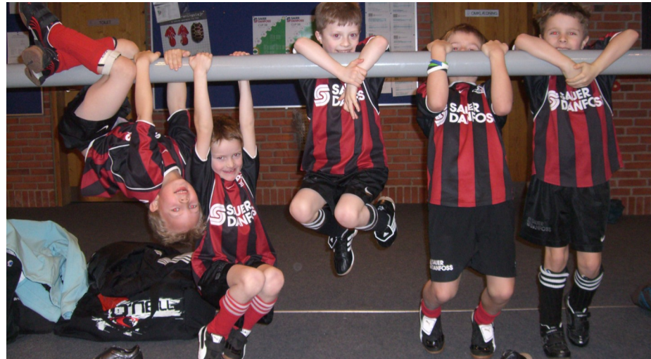
Primo april bliver de lukket ud i det fri!

I den ene ende af skalaen har vi de små livlige og til tider noget frække abe-katte , som er synonym med vore alleryngste, de boltrer sig stadigvæk inden døre i hallen indtil omkring primo april, hvor vi så lukker dem ud i det fri.