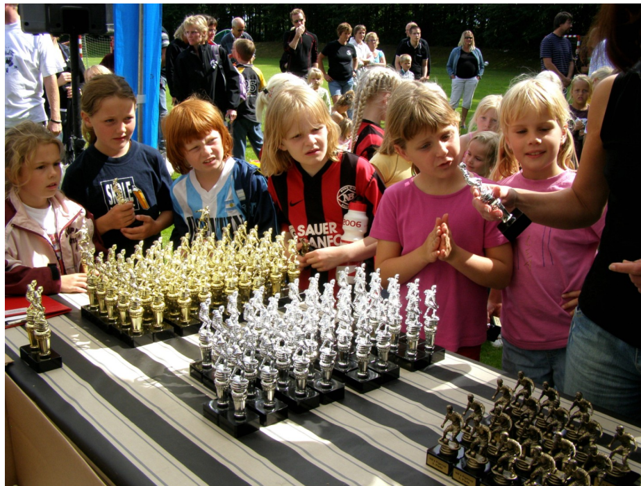
En af grenene på klubbens "aktivitetstræ" er NB-PIGECUP

Således er hjælpebanken nu i gang med en tiltrængt ajourføring og en tilpasning til vore nutidige behov. Dette arbejde vil ske her i første halvår af 2008.