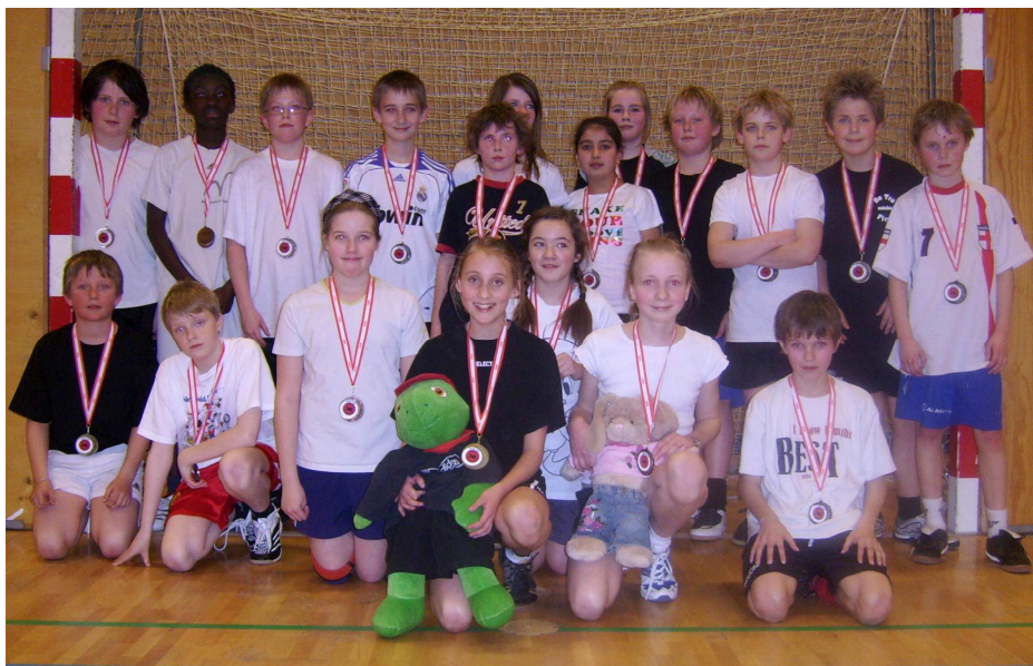
Nordborg skoles 5.B stillede med hele 3 hold ved årets SKOLE CUP!