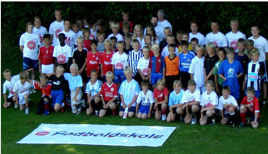
Arkivfoto fra 2007

Der er åbent for tilmelding for børn og unge, der såvel i forvejen spiller fodbold i en klub, som for dem der bare gerne vil være med til en sjov fodbold-uge i sommerferien.