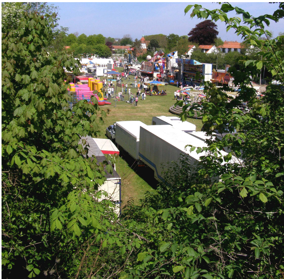
Festpladsen i "dalen" (Luffes Plads i Nordborg)