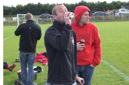
Stygt billede af medrejsende NB fans

Et af de andre nye tiltag har været PR omkring hjemmekampene, hvorfor der forud for hjemmekampene reklameres flittigt rundt omkring i byen, dette gælder ligeledes 2. holdets hjemmekampe, når de spiller umiddelbart inden 1. holdet. Så folk skal slet ikke være i tvivl om, hvornår der spilles noget godt bold på stadion. Derudover forsøger vi at skabe en hyggelig atmosfære omkring selve kampene, ved hjælp af lidt go' musik, og når vejret tillader det, bliver der også grillt pølser ved klubhuset.