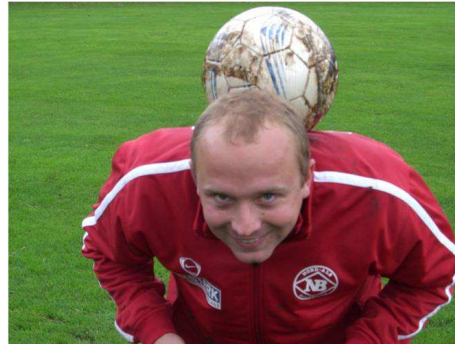
"El Smidinho" viser hvordan vi i NB holder på bolden"

Trods det, at en videre oprykning ikke er et direkte mål - 3 oprykninger på striben, er jo ikke noget man må tage som givet - er vi vist alle rigtig glade og stolte over, at NB atter er at finde i det bedre selskab, når vi snakker lokal fodbold - det lover rigtig godt for forårets resterende 11 kampe !