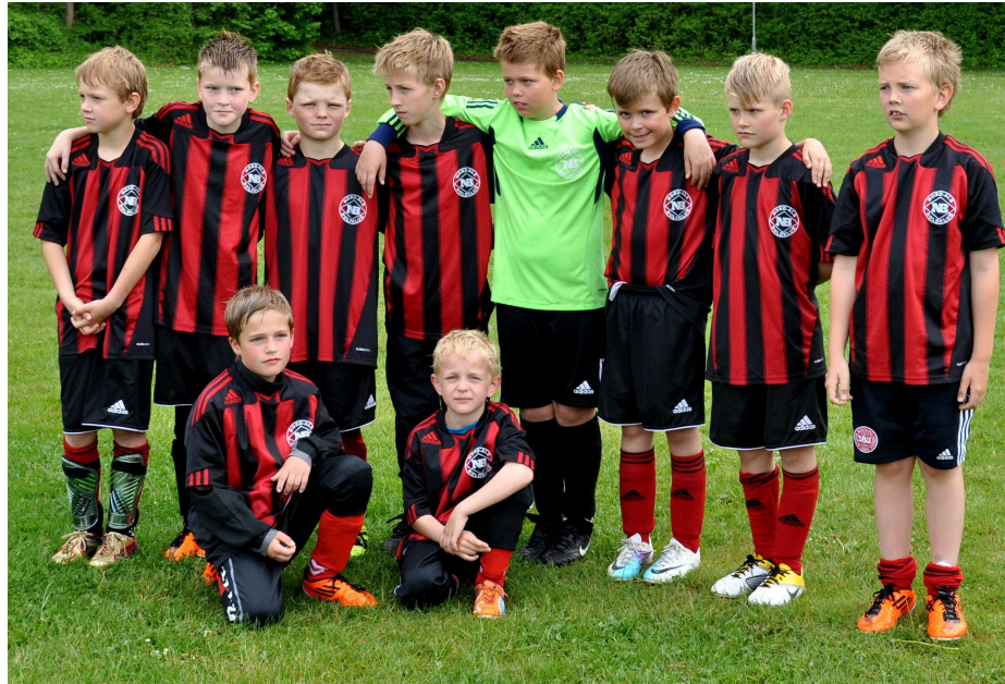
NB's U10 fik en 3. plads ved FEST-I-CUP 2011

Nord-Als Boldklub's klubblad - 42. årgang - Nr. 3 - juni 2011