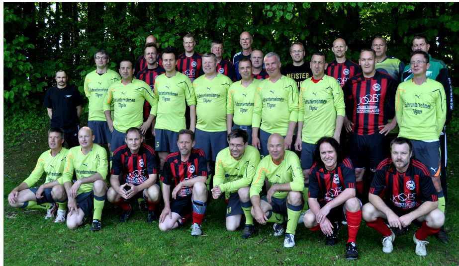
NB og VFL før udfordringerne på Langesø Stadion om lørdagen

Tremsbüttel er beliggende nord for Hamborg. Hvis det har interesse kan i besøge deres hjemmeside: http://www.vfltremsbuettel.de/fussball/