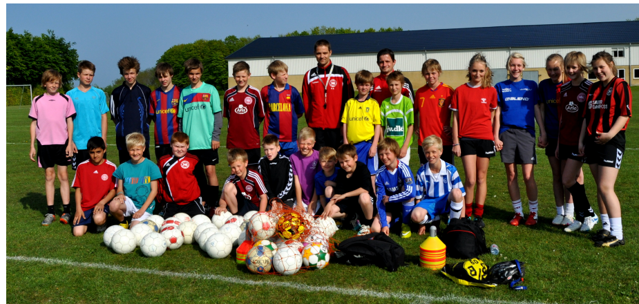
Deltagerne ved første træningsdag

Teknik Fredag er kommet flyvende i gang og i skrivende stund er den afviklet to gange. Tilslutningen til projektet har været rigtig flot. Den første gang havde hele 25 unge NB spillere fundet vej til banerne ved Idrætscentret og anden gang mødte 16 spillere op. Anden gang var der 5 nye spillere i forhold til første gang, så det vil sige at 30 unge NB spillere har deltaget.