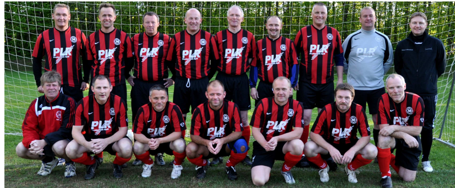
Veteranholdet ligger *i skivende stund på en 8. plads i rækken