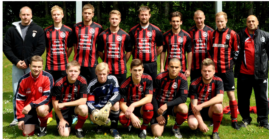
Serie 5 holdet ligger i skrivende stund på en flot 2. plads i rækken

det vilde, men det ekstra point fik vi over et hold der i den første kamp slog os 4-0 og pt ligger på 2. pladsen. Så jeg syntes det vidner om et hold i fremgang og jeg har en forventning om flere point i de kommende kampe, samt opfyldning af målet for sæsonen: Forbliven i serie 2.