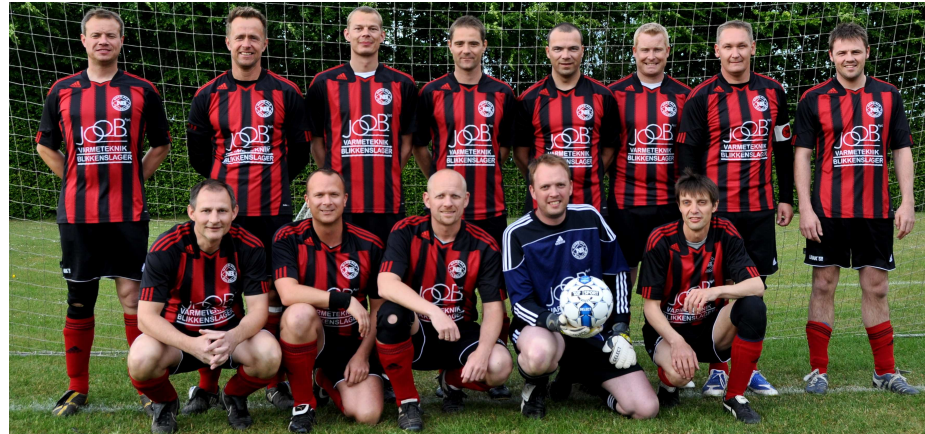
Oldboysholdet ligger (*uge 22) i skivende stund på en 4. plads i rækken