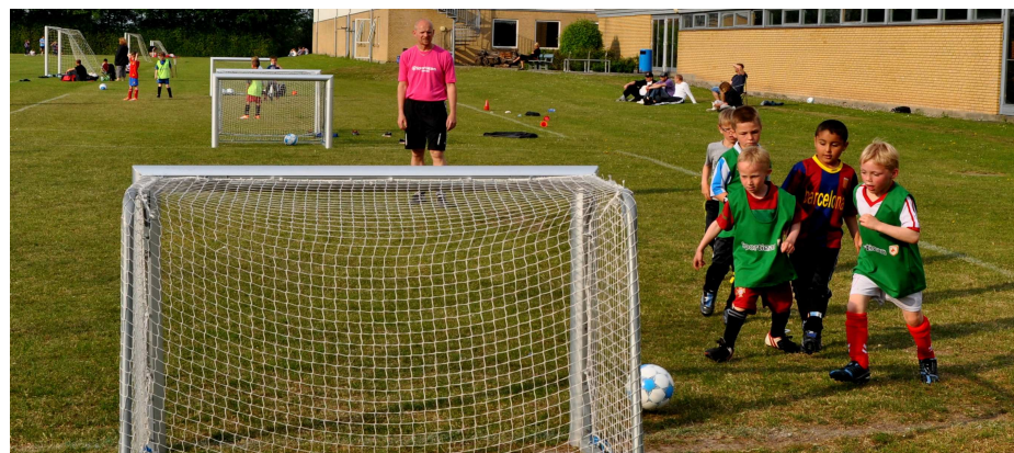
Træning U7 drenge