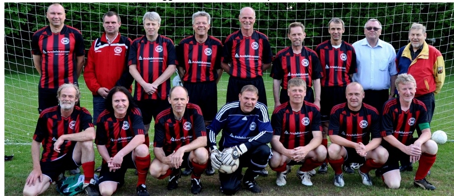
Superveteranerne ligger *i skivende stund på en 6. plads i rækken