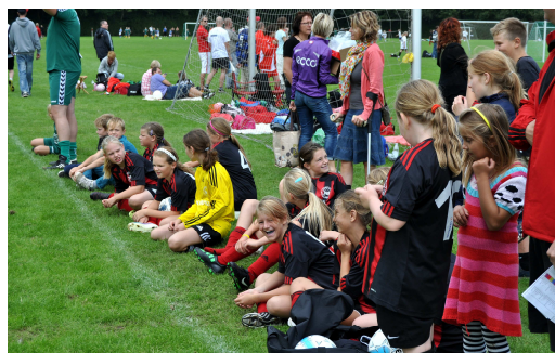
PIGECUP, selvfølgelig også med NB's U13 hold