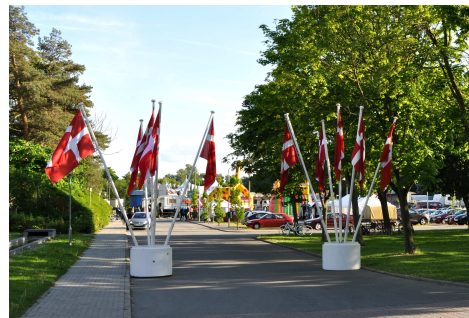
Vi ses i 2012!