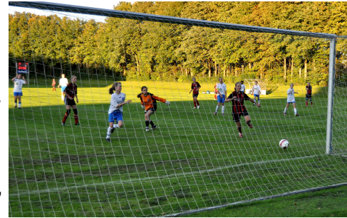
Mål til 4-1!

Søndagen stod på en flot spillet kamp fra samtlige piger på holdet. En stor fightervilje og en kampgejst der lugtede langt væk af en sejr allerede under taktikmødet før kampen. Pigerne udviser en stor disciplin, og kommer med konstante positive glosor og bakker hinanden op. Nu hvor der nævnes opbakning, så fik jeg virkelig mine øjne op da jeg så hvor mange forældre og pårørende der var mødt op på stadion for at se et U15 pige hold.