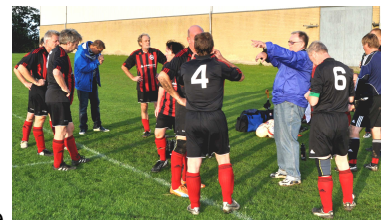
Halvleg hos Superveteranerne

Efterårsturneringen i JBU's oldboysrækkerne har en lidt "broget" puljesammensætning, som for NB's 3 turneringshold betyder, at man spiller i puljer med 4, 7 og 9 hold!