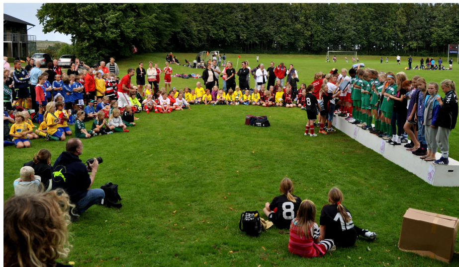
Stævnet sluttede med en festlig præmieoverrækkelse

Billederne fra dagen taler for sig selv!