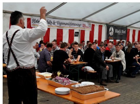
Årets Herrefrokost har slået alle rekorder

Jamen, det har ikke været så ringe endda - selvom der var færre deltagere både til Søløbet, Damefrokosten og til Hyggeeftermiddagen. Til gengæld slog Herrefrokosten alle rekorder, hvor der også var tilmeldinger både fra Tyskland (fodboldfolk) og Skotland (Golf-gæster). Fod-