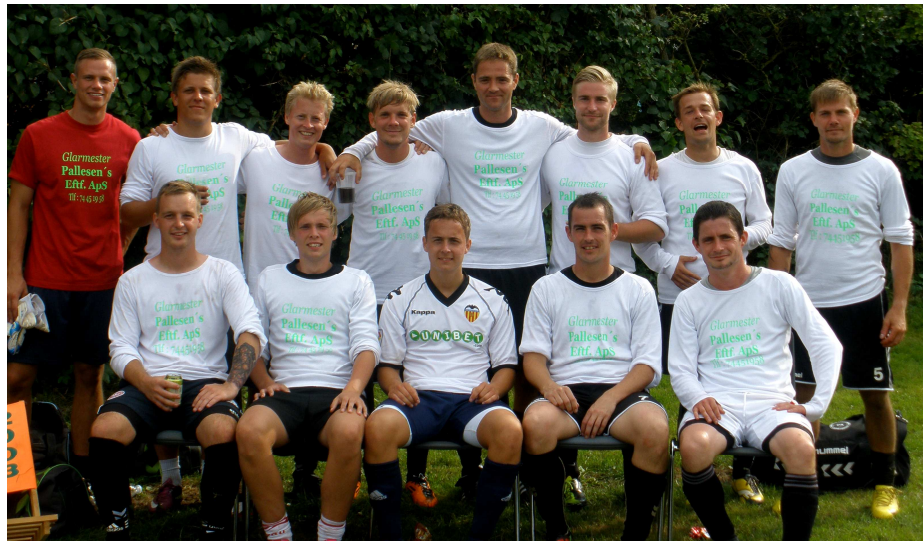
"Piruetteløgen m. Venner"

Holm Cup 2011, blev afholdt lørdag den 6. august og var som altid et virkelig godt socialt arrangement. Humøret hos alle var i top, vejret var godt og udfordringen med banen, som havde et dybt spor fra en tromle, blev klaret med ægte Holm-gåpåmod. Jeg kan kun opfordre alle til at komme forbi til Holm Cup næste år.