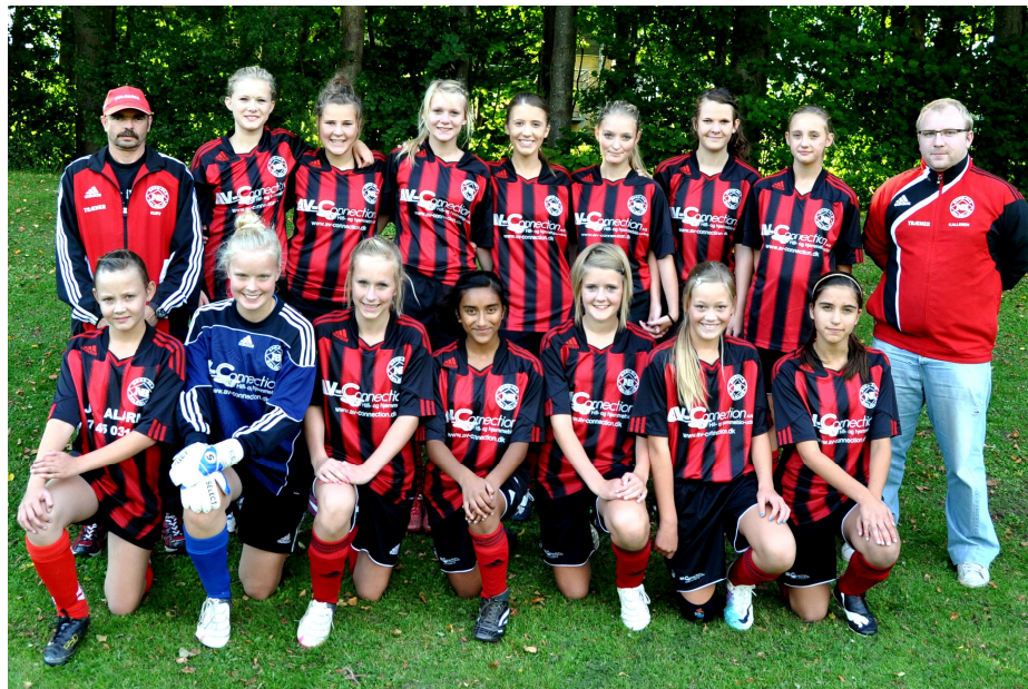
NB's U15 før kampen mod Tønder som pigerne vandt med 4-2. Læs mere om holdet på side 14