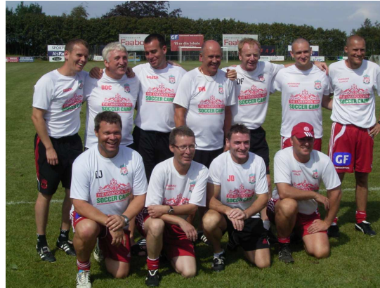
LFC fodboldskole teamet, bl.a. med de prominente David Johnson (nr. 2 bagerst fra venstre), Phil Neal (den "unge herre" der står i midten bagerst)samt David Fairclough (nr. 3 bagerst fra højre)

Der var ca. 130 børn med fra hele Danmark, de fleste naturligvis LFC fans. Ungerne blev alders-opdelt og fik hver deres træner - men kom dog rundt og blev trænet af alle Legends spillerne i løbet af skolen. De hold, spillede de så på de 2 første dage, hvorefter der blev lavet blandede hold, og så blev der afholdt en stor VM turnering den sidste dag. Det at spille kamp med andre unger som de ikke kendte samt med engelske trænere - der stod og råbte på sidelinien - var en anderledes og spændende oplevelse for børnene.