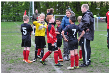
5. maj - U9 drenge i Nordborg