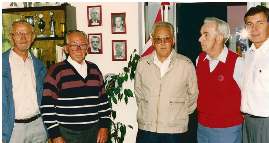
4 æresmedlemmer med formanden (Billedet blev lavet i 1993 til jubilæumshæftet "25 år Nord-Als Boldklub i 1994").