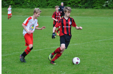
9. Juni - U14 drenge mod SUB