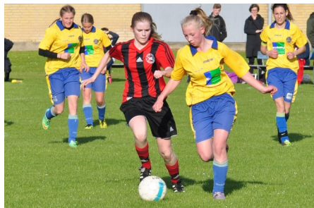
3. Juni - U17 piger mod Aabenraa