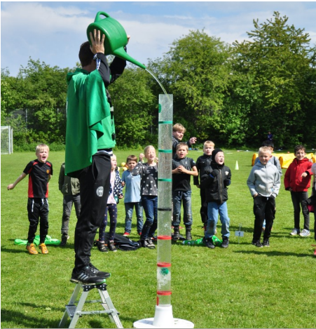
Pomfritten på besøg i Nordborg d. 21. maj

Både "Kom ud af pomfritten" og "Pigeraketten" har i den seneste tid været forbi Nordborg. Begge projekter blev afholdt af NB i samarbejde med DBU. "Kom ud af pomfritten" er et projekt for både piger og drenge, mens "Pigeraketten" kun er for piger. Førstnævnte blev afholdt på sportspladsen ved Nordals Skolen i solskin, hvor SFO'erne i området var inviteret, mens "Pigeraketten" blev afholdt ved Nordals Idrætscenter, desværre i regnvej. Mit indtryk er at begge arrangementer var gode oplevelser for børnene og viste NB og fodbolden fra sin sjove og legende side.