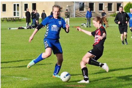
8. juni - U13 piger mod Agerskov