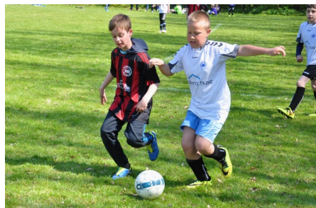
3. maj - U10 drenge Fest i By Cup