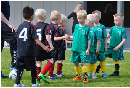
7. Juni - U6 i Guderup