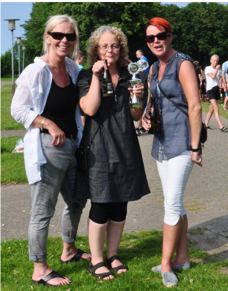
Fra NB dagen 2015