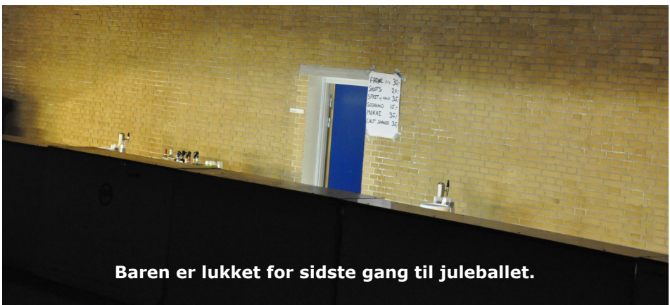
Baren er lukket for sidste gang til juleballet.