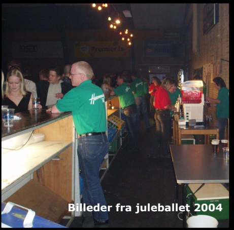
Billeder fra juleballet 2004